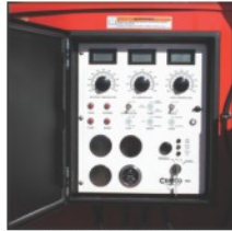
集成化的控制系统 包含了线路总开关和引擎的控制，可以完成所有参数的设定，减少误操作。方便、快捷的启动