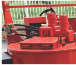
搅拌器自动开关和防溅盖板 加料口盖板防溅设计有效防范烫伤风险，高强度铰链降安装为降低加料时的工作强度提供了保证；自带的安全开关和搅拌器互锁，打开盖板时，搅拌器自动停止搅拌提高了安全性。