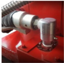
90度水平出料旋转头 90度的垂直设计保证了车载式SS60D工作时可以充分伸展输胶软管，极大程度保护车载式软管不被过度弯曲，并增大了工作范围。

超级融胶灌缝机在设计上增加了很多的安全措施来保护操作者和施工人员。除了标配的安全装置以外，还有其他可供选择的工程配置诸如自动上料机，可以使得操作者远离加热的融胶也提高了上料的效率。机身后部位置操作保证了操作者得以远离设备两旁的交通状况而处于安全的工作区域，带轴承的软管旋臂降低了操作者的疲劳程度。带有安全开关的防溅加料口盖板可以防止熔融的密封胶溅出烫伤操作者。这些富有创意的特性使得科来福超级灌缝机成为当前同类型产品中最安全的设备。