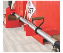
作业间歇转移支撑架 最大程度降低在移动过程中操作者需手持设备付出的劳动强度，同时保护好输胶软管和喷胶枪免于损坏。