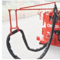
电加热输胶软管 安全低压电加热输胶软管可以配合燃烧器工作将密封胶的熔融状态保持到输胶管出口的最前端，科来福的输胶软管可以360度旋转，配合90度水平出料旋转头可以最大范围覆盖工作区域。